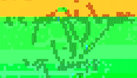
5. Charter of Fungsional