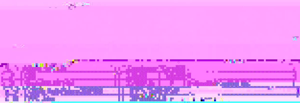
Figure 1. Geological cross-section of the study area.