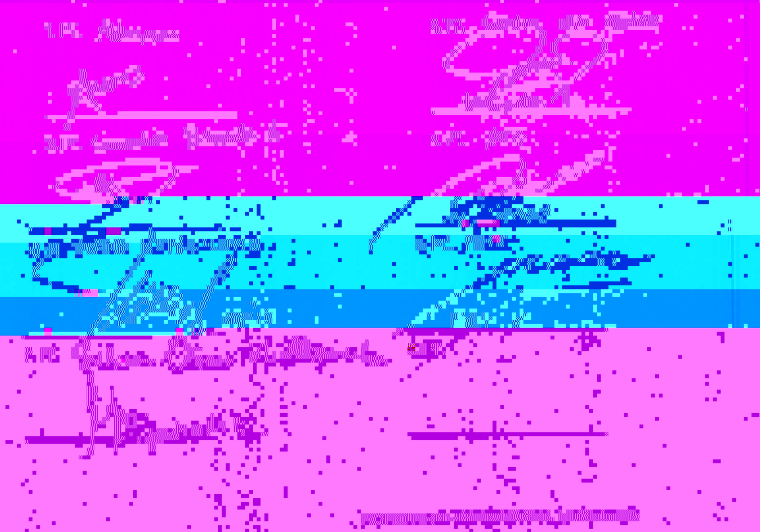
Gambar 1.1.2. Distribusi jawaban pertanyaan nomor 12. Apakah pelayanan kesehatan di Puskesmas dapat meningkatkan kualitas pelayanan kesehatan?