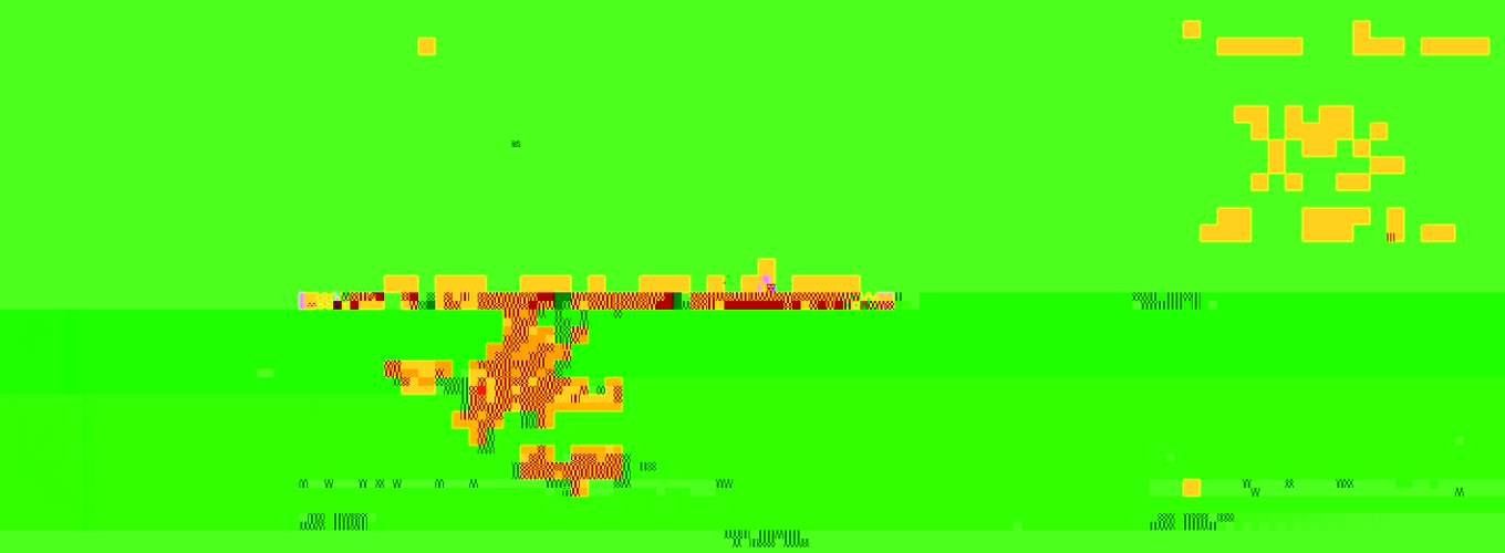
Gambar 1.2. Lokasi Penelitian