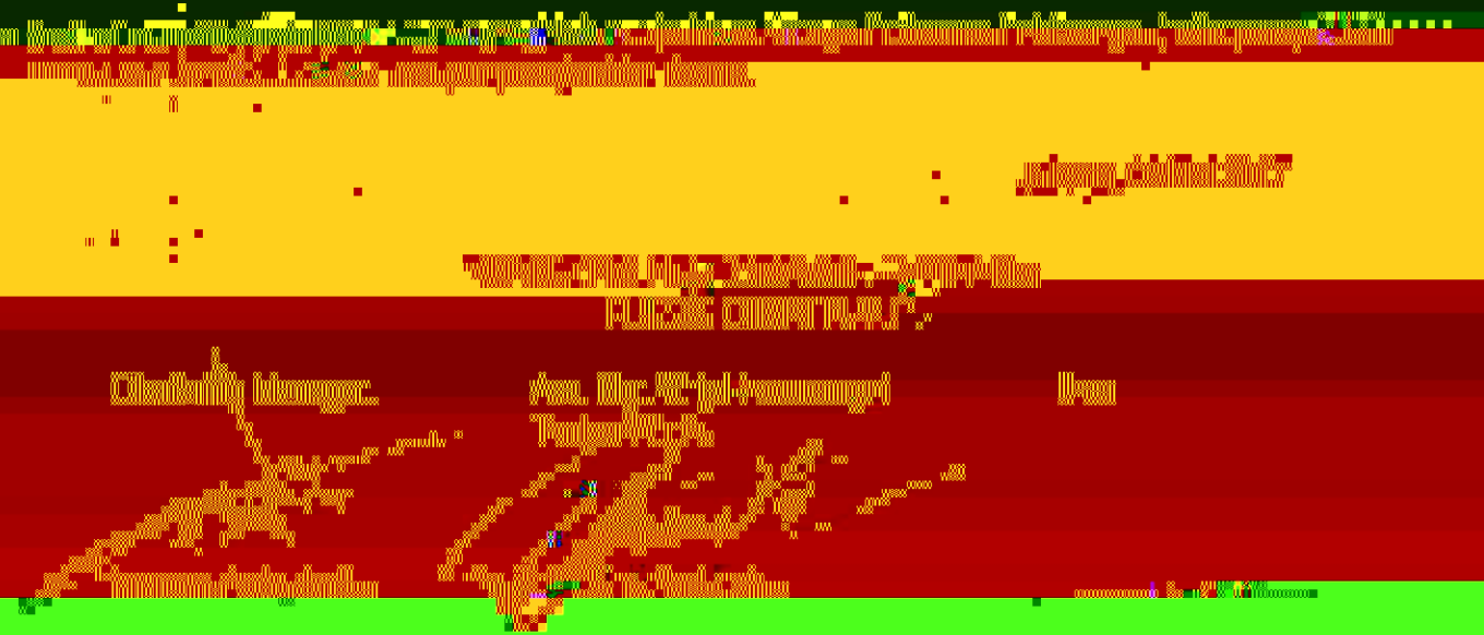
Gambar 1.1. Lokasi Penelitian

Demikian Berita Acara ini dibuat untuk dapat dipergunakan lebih lanjut dan perubahan yang diberlakukan pada saat pelaksanaan ini telah disetujui dan dimaklumi para peserta.